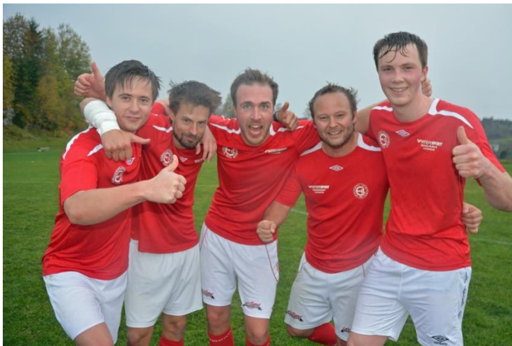
Høydepunkt 2017: Ekne – Bøgda: 6 – 1