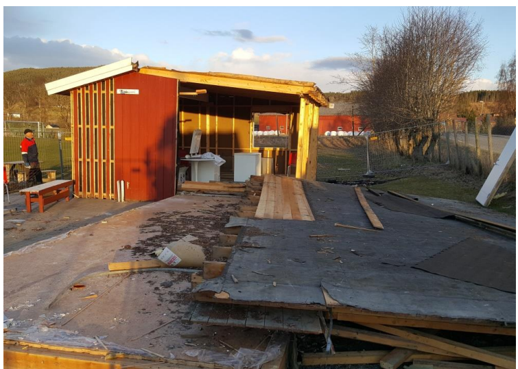
Lav takhøyde i det gamle klubbhuset, 25.04.17 kl 20:20