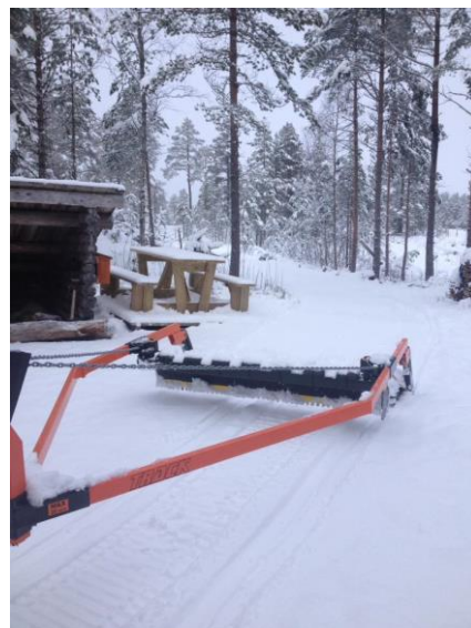
Løypeprepping ved Torvmyra.

Det er umulig å omtale trim i nærområdet uten å nevne storsukssen 10 PÅ TOPP. Blant toppene er hele fire stykker å finne her på Ekne: Torvmyra, Våttåberget, Migtjønna og Fjellhov. Både Eknesbygg og utabygdes folk har fått øynene opp for disse flotte turmålene. Her må jeg trekke fram Torvmyra, som gjennom flott dugnadsinnstast det siste året er blitt opprustet med nygruset vei. Dette er blitt et lavterskels turmål for alle, inkludert de som ferdes med barnevogn eller rullestol.