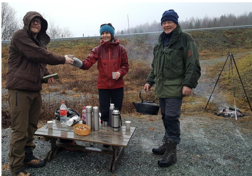
Romjulsmarsj i lett regnvær med kaffeservering ved Mølla

Til tross for lederbytte ønsker gruppa å beholde arrangementer som etter hvert er blitt gode tradisjoner, som f.eks. Romjulsmarsjen og famileturdager. Målet er som før; å legge forholdene til rette for et aktivt trim- og friluftsliv på Ekne.