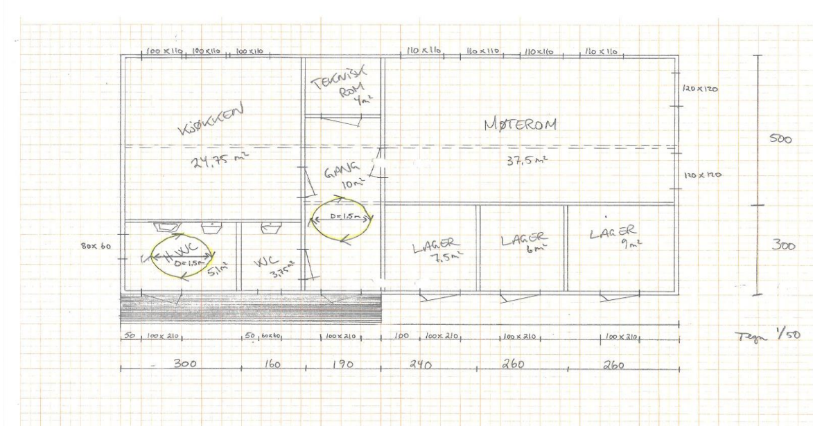
Plantegning av det nye klubbhuset

Vi satser på stor dugnadsinnsats av folk på bygda, og at det nye klubbhuset blir et flott nytt bygg på Ekne.